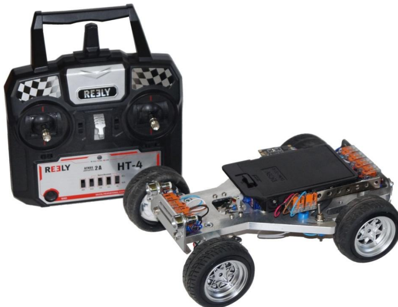
Elektroauto mit Fernsteuerung

Die acht Modelle des Modellsystems „3D-HYSOLAR-Home“ sind: Elektroauto, Auto mit reversibler Brennstoffzelle, Solar-Sonnenblume, Solarstromanlage, Stromversorgung, Wasserstoffmodelle, Wärmedämmung und Wohnhaus.